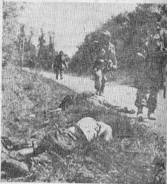
Soldados de los Estados Unidos avanzan por una carretera de Francia a la vista de los cadáveres de soldados nazis que bordean el camino. Dominadas las defensas de la costa, las fuerzas aliadas se internaron rápidamente en territorio francés. Foto transmitida a Washington por radio desde Londres.